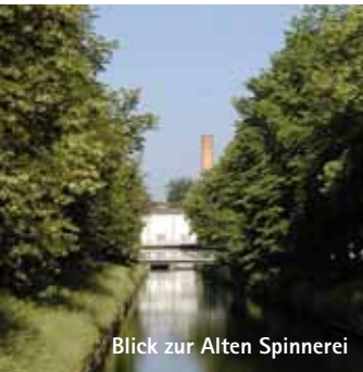
Blick zur Alten Spinnerlei

Die Stadt Kolbermoor wurde erst im Jahr 1863 gegründet und ist damit die jüngste Gemeinde im Landkreis Rosenheim. Aus der ursprünglichen Industrie- und Arbeiterbesiedlung entwickelte sich rasch ein aufstrebender Ort, der mittlerweile knapp 19.000 Einwohner hat.