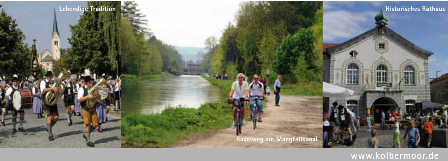
Lebendige Tradition, Historisches Rathaus, Radweg am Mangfallkanal