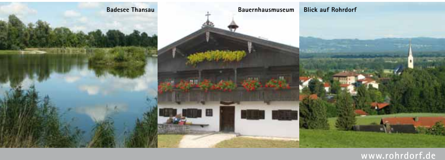
Badese Thansau, Bauernhausmuseum, Blick auf Rohrdorf

440-650 m, 2.815 ha Gesamtfläche, erste urkundliche Erwähnung 788, 5.700 Einwohner, 300 Gästebetten. Das Gemeindegebiet reicht vom Fuß des Samerberges bis zum Inn und umfasst unter den 34 Ortsteilen auch die Dörfer Achenmühle, Höhenmoos, Lauterbach und Thansau. Der Ortskern von Rohrdorf liegt etwas erhöht auf einem wenig ausgeprägten Rücken, der vom Samerberg nach Norden zieht. Die angrenzenden, ehemals sumpfigen Niederungen der Innebene wurden in geschichtlicher Zeit zu fruchtbaren Äckern und Wiesen verwandelt. Mit dem Hotel zur Post in der Ortsmitte besitzt Rohrdorf einen renommierten Gastronomiebetrieb von überregionaler Bedeutung. Sehenswert Kath. Pfarrkirche St. Jakobus d. Ä. Der nach dem letzten Kirchenbrand 1769-73 entstandene Saalbau ist ein Werk des kurfürstlichen Hofmauriers-