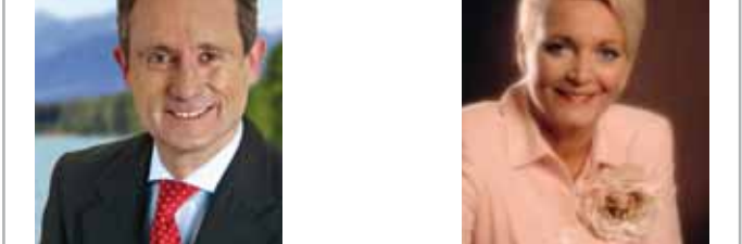
Liebe Bürgerinnen und Bürger, verehrte Gäste aus nah und fern,

Sie halten gerade die erste Auflage der Karte zum neuen Radwanderweg „Radeln rund um Rosenheim“ in Händen.