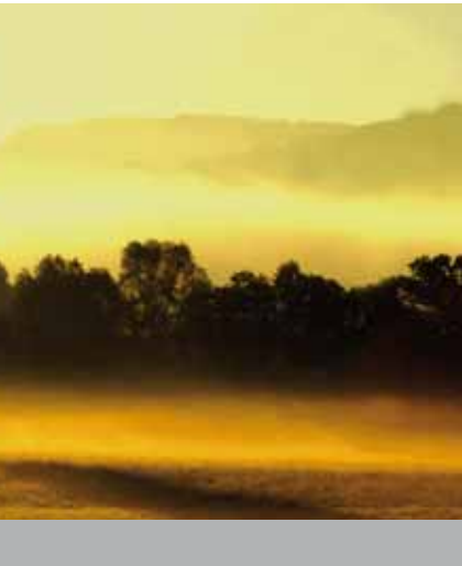
Thalreit, Herbstlicht, Großholzhausen

Die ältesten Siedlungsspuren im Gemeindegebiet, am Ziegelberg und am Döblergraben, gehen auf das 4. und 3. Jahrtausend vor Christus zurück. Unter den Römern gehörte der Bereich um Leonhardspfunzen zur Siedlung Pons Aeni. Die Innbrücke lag damals nördlich von Leonhardspfunzen bei Mühlthal. 1130 wird das Dorf Stephanskirchen erstmals urkundlich als „stevenchirgen“ erwähnt.