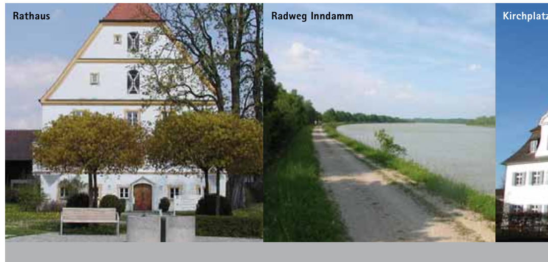
Rathaus, Radweg Inndamm, Kirchplatz Pfaffenhofen

Die Gemeinde Schechen, mit einer Fläche von 3.174 ha, liegt im Norden von Rosenheim und umfasst 36 Ortsteile. Sie entstand bei der Gebietsreform 1978 durch den Zusammenschluss der bis dahin selbständigen Gemeinden Hochstätt, Marienberg und dem nördlichen Teil der ehemaligen Gemeinde Westerdorf St. Peter mit dem Pfarrdorf Pfaffenhofen. Schechen war ein Hausendorf im Inntal am Rand des westlich der Talsohle verlaufenden Moränenzuges. Bis Mitte des 13. Jahrhunderts gehörte das Gebiet zur Grafschaft Wasserburg, dann immer zu Bayern. Der Ortsname kommt von „sacha“ (= Waldstück) und erscheint erstmals im Jahre 1311 als „Schechen“.