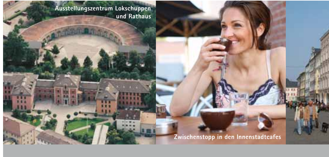
Ausstellungszentrum Lokschuppen und Rathaus, Zwischenstopp in den Innenstadcafés, Max-Josefs-Platz

Die reizvolle Mischung aus italienischem Lebensgefühl und alpenländischer Gemütlichkeit spürt man am besten am weitläufigen Max-Josefs-Platz , dem Herz der historischen Altstadt. Hier laden malerische Cafés und Kaffee-