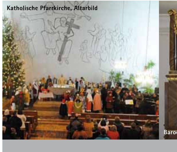
Katholische Pfarrkirche, Altarbild, Barockorgel, Evangelische Karolinenkirche

Trotz der großen baulichen Entwicklung des Ortes nach den Kriegsjahren kann man heute noch die Strukturen der ersten Besiedlung erkennen. Besonders in der Pfälzerstraße hat sich der Pfälzer Baustil – alle Häuser stehen mit der Giebel- seite zur Straße – noch teilweise erhalten. Erstmals siedelten sich auf altbayerischem Boden auch Protestanten an. Daher wurde auch in Großkarolinenfeld die erste evangelische Kirche im südost- bayerischen Raum gebaut. Sie zählt zu den besonderen Sehenswürdigkeiten des Ortes.