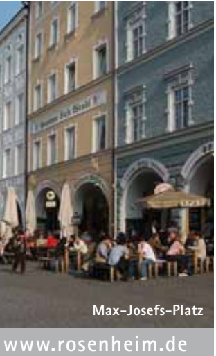
Ausstellungszentrum Lokschuppen und Rathaus, Zwischenstopp in den Innenstadcafés, Max-Josefs-Platz

Die reizvolle Mischung aus italienischem Lebensgefühl und alpenländischer Gemütlichkeit spürt man am besten am weitläufigen Max-Josefs-Platz , dem Herz der historischen Altstadt. Hier laden malerische Cafés und Kaffee-