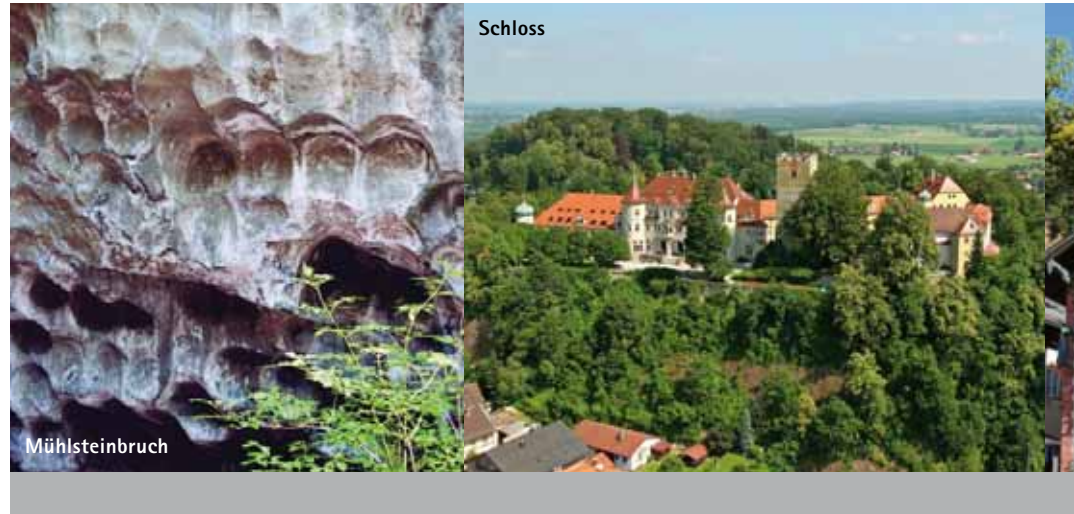
Mühlsteinbruch, Schloss, Gästeformation