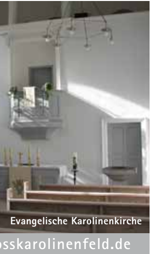
Thalreit, Herbstlicht, Großholzhausen

Die ältesten Siedlungsspuren im Gemeindegebiet, am Ziegelberg und am Döblergraben, gehen auf das 4. und 3. Jahrtausend vor Christus zurück. Unter den Römern gehörte der Bereich um Leonhardspfunzen zur Siedlung Pons Aeni. Die Innbrücke lag damals nördlich von Leonhardspfunzen bei Mühlthal. 1130 wird das Dorf Stephanskirchen erstmals urkundlich als „stevenchirgen“ erwähnt.