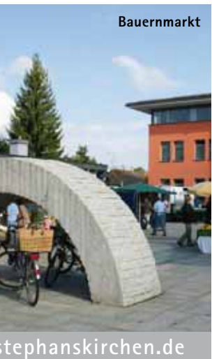
Ausstellungszentrum Lokschuppen und Rathaus, Zwischenstopp in den Innenstadcafés, Max-Josefs-Platz

Rosenheim ist der Inbegriff einer weissen Bilderbuchstadt mit atemberaubendem Alpenpanorama – und das nicht erst seit dem Erfolg der ZDF-Serie „Die Rosenheim Cops“. Es ist vor allem die ansprechende Architektur mit ihren pastellfarbenen Bürgerhäusern, den zahlreichen Arkaden und den imposanten Zwiebeltürmen der schmucken Kirchen, die der Stadt an Inn und Mangfall ihren besonderen Charme verleiht. Einst war Rosenheim, das 1234 erstmals urkundlich erwähnt wurde, ein wichtiger Marktplatz für Innschiffer und Salzändler. Heute gilt die Hochschul- und Handelsstadt mit ihren 60.000 Einwohnern als wirtschaftliches und kulturelles Zentrum Südbayerns.