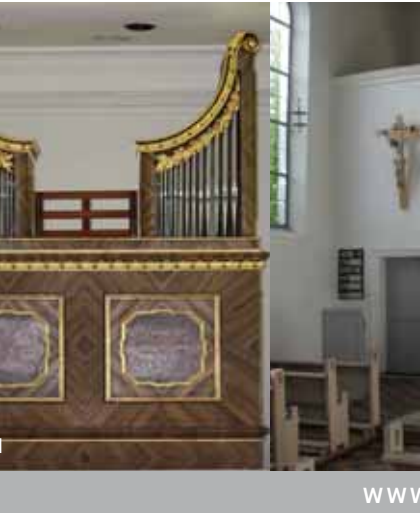
Feldkreuz Aich, Wegkreuze auf idyllischen Pfaden in Raubling und Umgebung – vermittelt ein Bild vom Leben der Vorfahren.

In den Feriendörfern Großholzhausen und Reichenhart stehen sanfter Tourismus im Einklang mit der Natur und einheimischer Lebensart.