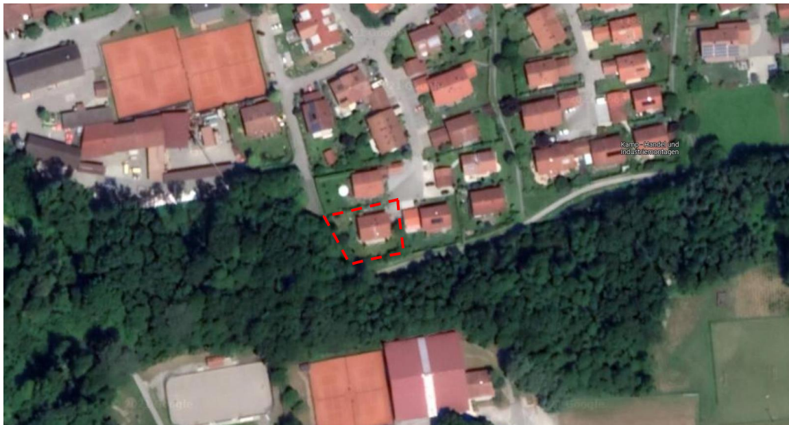
Abb. 1: Lage des Planungsgebietes – rot – ohne Maßstab!

Das Änderungsgebiet umfasst die Flurstücks-Nr. 65/7. Es hat eine Größe von ca. 840 m 2 . Von Osten nach Westen weist der Bereich eine Ausdehnung von ca. 35 m und von Norden nach Süden von ca. 26 m auf.